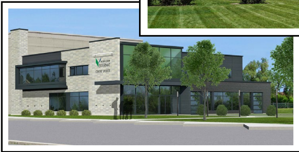
VISUEL RAPPROCHÉ DE LA PARTIE AVANT