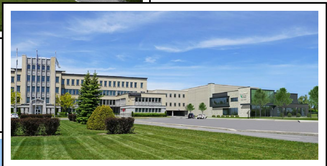
VISUEL À PARTIR DE L'AVANT DU COLLÈGE