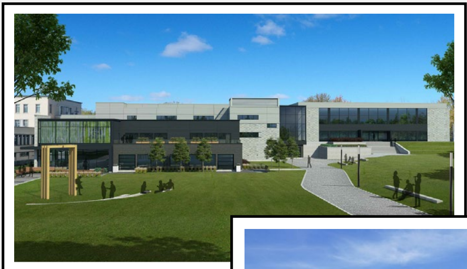
VISUEL D'ENSEMBLE DE L'AGRANDISSEMENT